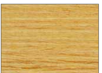
05 Pino - Pine - Kiefer - Сосна