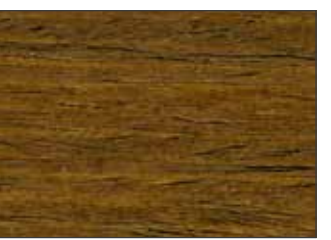
48 Rovere Medio - Medium Oak - Mittel Eiche - Средний Дуб