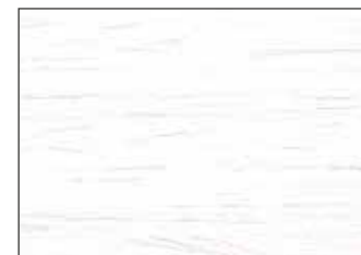
50 Bianco - White - Weiß - Белый