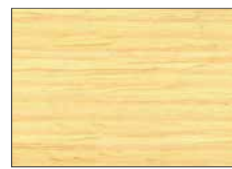
3322 Holzwachs Lasur HD50