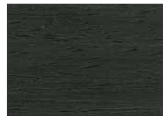
208 Grigio Traffico B - Traffic Grey B - Verkehrsgrau B - Транспортный Серый B