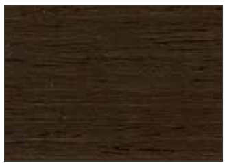
190 Marrone Mogano - Mahogany Brown - Mahagonibraun - Махагон Коричневый