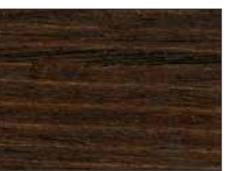
62 Mogano - Mahogany - Mahagoni - Махагон