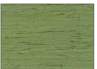
210 Verde Pallido - Pale Green - Blafgrün - Бледно-Зелёный