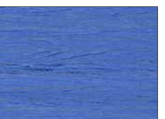
220 Blu Luce - Light Blue - Lightblau - Голубой