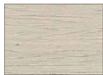
199 Grigio Tele 4 - Telegrey 4 - Telegrau 4 - Телерей 4