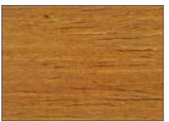
29 Ciliegio Chiaro - Light Cherry - Helle Kirsche - Светлая Вишня