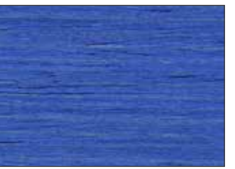
222 Blu Segnate - Signal Blue - Signalblau - Сигнальный Синий