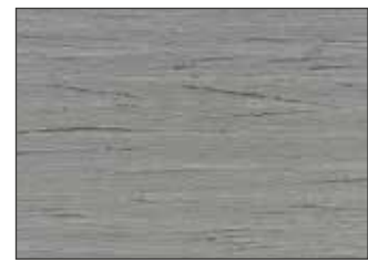
207 Grigio Finestra - Window Grey - Fenstergrau - Серое Окно