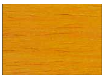
171 Arancio Segnate - Signal Orange - Signalorange - Сигнальный Оранжевый