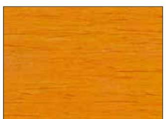
170 Arancio Giallastro - Yellow Orange - Gelborange - Желто-Оранжевый