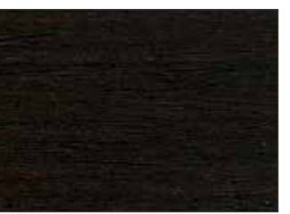
38 Palissandro Scuro - Dark Rosewood - Dunkle Rosenholz - Темный Палисандр