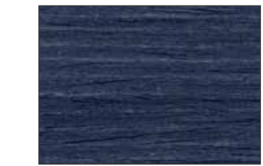
229 Blu Nerastro - Black Blue - Schwarzblau - Чёрно-Синий