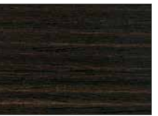
146 Wenge - Венге