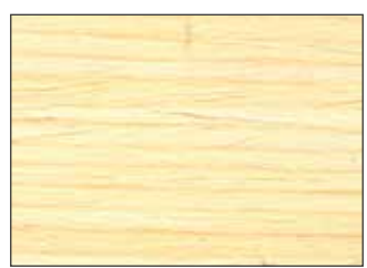
60 gloss: Naturaqua Top Gel, Holzwachs Lasur HD50