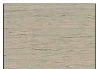
202 Grigio Agata - Agate Grey - Achatgrau - Агатный Серый