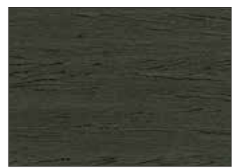
204 Grigio Tenda - Tarpaulin Grey - Zeltgrau - Брезентово-Серый