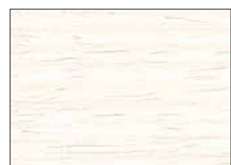
50 Bianco - White - Weiß - Белый