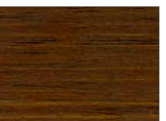
36 Mogano Chiaro - Light Mahogany - Helle Mahagoni - Светлый Махагон