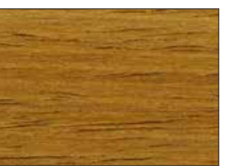
10 Larice - Larch - Lärche - Лиственница