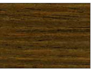
59 Noce Medio - Medium Walnut - Mittelwalnuss - Средний Орех