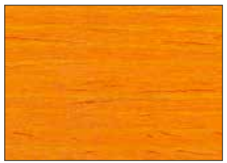
172 Arancio Rossastro - Red Orange - Rotorange - Красно-Оранжевый