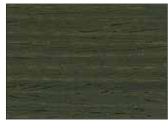
209 Grigio Verdastro - Green Grey - Grüngrau - Зелёно-Серый