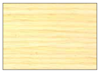
90 gloss: Flating Extra Marine