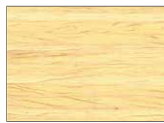
3351 Naturaqua Top Gel, 3305 Top Gel Tixo