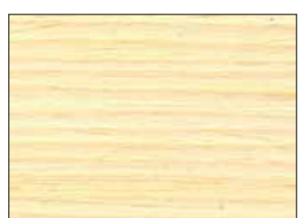
30 gloss: Naturaqua Top Gel, Top Gel Tixo, Holzwachs Lasur 3in1, Naturaqua Dekorwachs Lasur, Dekorwachs Lasur