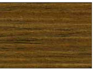
52 Rovere Scuro - Dark Oak - Dunkle Eiche - Темный Дуб