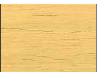
200 Avorio - Ivory - Elfenbein - Слоновая Кость