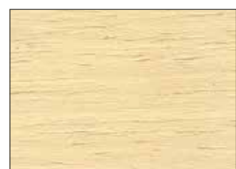
201 Avorio Chiaro - Light Ivory - Hellelfenbein - Светлая Слоновая Кость