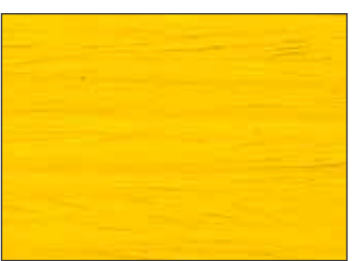
160 Giallo Navone - Colza Yellow - Rapsgebl - Рапсово-Жёлтый