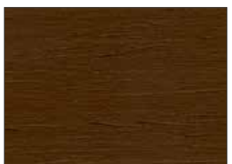
59 Cioccolato - Chocolate - Schokolade - Шоколад