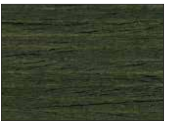
214 Verde Abete - Fir Green - Tannengrün - Пихтовый Зелёный