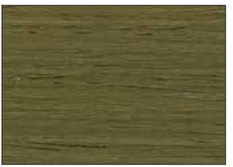
212 Verde Canna - Reed Green - Schilfgrün - Тростниково-Зелёный