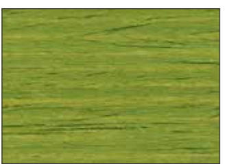
211 Verde Giallastro - Yellow Green - Gelbgrün - Желто-Зелёный