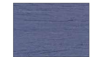
226 Blu Colomba - Pigeon Blue - Taubenblau - Голубино-Синий