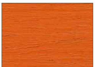
122 Arancio Orchidea - Orchid Orange - Orchid Orange - Оранжевая Орхидея