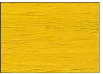
161 Giallo Limone - Lemon Yellow - Zitronengelb - Лимонно-Жёлтый