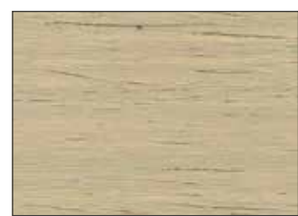
205 Grigio Seta - Silk Grey - Seidengrau - Серый Шёлк