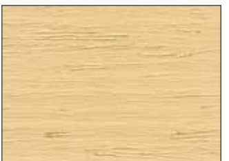
115 Avorio - Ivory - Elfenbein - Слоновая Кость