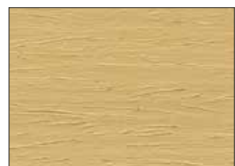
06 Senape Naturale - Natural Mustard - Natürlicher Senf - Натуральная Горчица