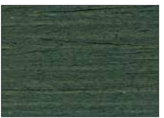
213 Verde Muschio - Moss Green - Moosgrün - Зелёный Мох