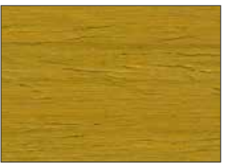
163 Giallo Curry - Curry - Currygelb - Карри Жёлтый