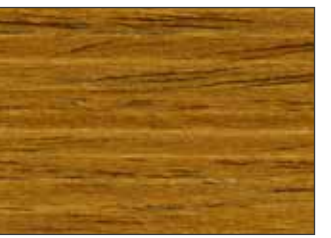
57 Noce Biondo - Blond Walnut - Blonde Walnuss - Белый Орех