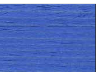
221 Blu Cielo - Sky Blue - Himmelblau - Небесно-Синий