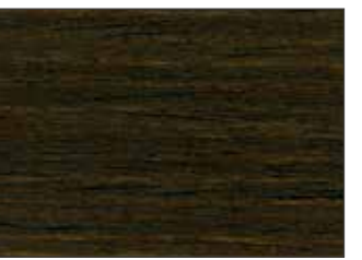
63 Noce Scuro - Dark Walnut - Dunkle Walnuss - Темный Орех