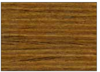
17 Teak - Тик