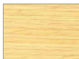
3610 Holz Lasur

Glossaggi - Sheen levels - Glanzgrad - Степень блеска