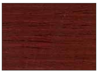
180 Rosso Marrone - Brown Red - Braunrot - Коричнево-Красный