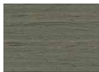
203 Grigio Cemento - Cement Grey - Zementgrau - Цементно-Серый