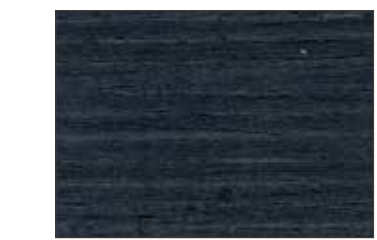
228 Blu Grigiastro - Grey Blue - Graublau - Серо-Синий