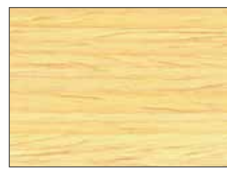
3323 Holzwachs Lasur HS