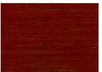
125 Rosso Papavero - Poppy Red - Mohnrot - Красный Мак