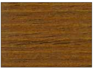
16 Ciliegio - Cherry - Kirsche - Вишня