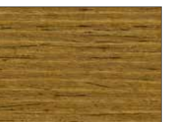
53 Noce Chiaro - Light Walnut - Helle Walnuss - Светлый Орех