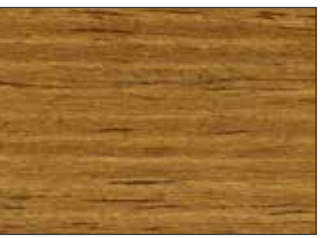
03 Rovere - Oak - Eiche - Дуб