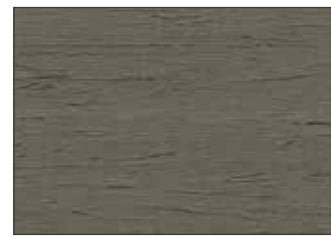
206 Grigio Calcestruzzo - Concrete Grey - Betongrau - Серый Бетон