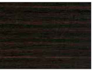
58 Palissandro - Rosewood - Rosenholz - Палисандр