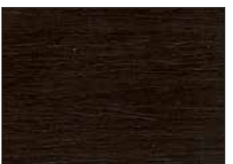
63 Cioccolato Fondente - Dark Chocolate - Dunkle Schokolade - Тёмный Шоколад

N.B.: La versione all'acqua è disponibile anche in colore 9010 Superwhite - The water-based version is also available in 9010 Superwhite colour - Die wasserbasierte Version ist auch in der Farbe 9010 Superwhite erhältlich - Версия на водной основе поставляется также в цвете 9010 Superwhite.