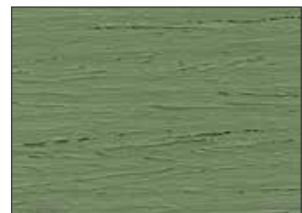
133 Verde Salvia - Sage Green - Salbeigrün - Шалфейный Зелёный