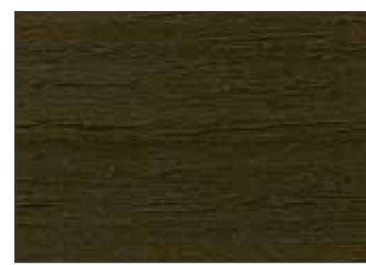
218 Oliva Giallastro - Yellow Olive - Gelboliv - Жёлто-Оливковый