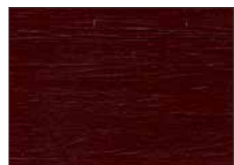
128 Rosso Mogano - Mahogany Red - Mahagoniro - Красный Махагон