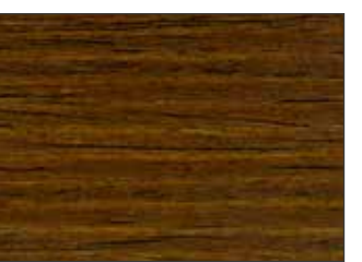
56 Noce Dorato - Golden Walnut - Goldene Walnuss - Золотистый Орех