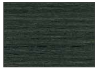
217 Verde Nerastro - Black Green - Schwarzgrün - Чёрно-Зелёный