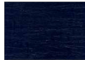
140 Blu Profondo - Deep Blue - Tiefblau - Глубоко Синий