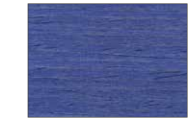
227 Blu Distante - Distant Blue - Fernblau - Отдалённо-Синий