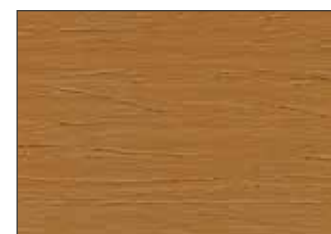
42 Aragosta - Lobster - Hummer - Лобстер