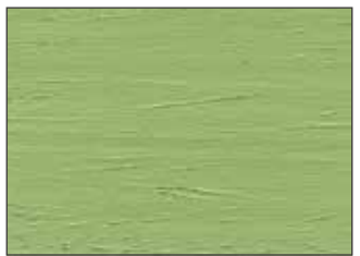
81 Verde Primavera - Spring Green - Frühlingsgrün - Зелёная Весна