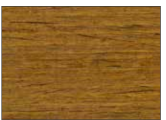
09 Teak Chiaro - Light Teak - Helle Teak