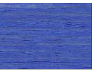
223 Blu Oltremare - Ultramarine Blue - Ultramarinblau - Ультрамариново-Синий