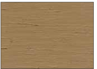
116 Tortora - Dove Grey - Taube - Серо-Коричневый