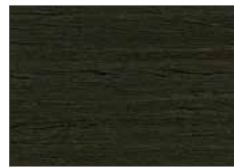
219 Oliva Nerastro - Black Olive - Schwarzoliv - Чёрно-Оливковый