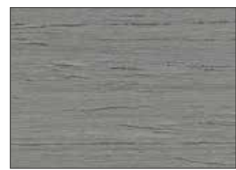
198 Grigio Tele 1 - Telegrey 1 - Telegrau 1 - Телерей 1