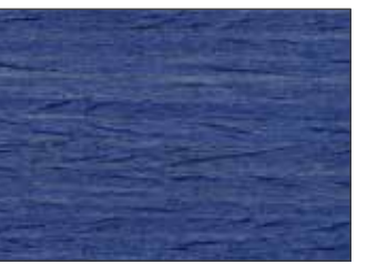
224 Blu Zaffiro - Sapphire Blue - Saphirblau - Сапфирово-Синий