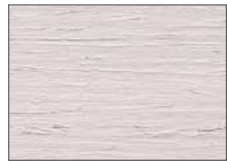
100 Grigio Ghiaccio - Ice Grey - Eisgrau - Серый Лёд