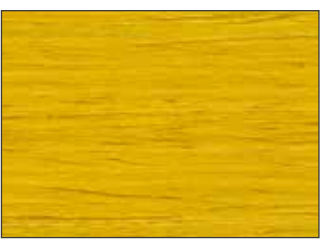
162 Giallo Miele - Honey Yellow - Honiggelb - Медово-Жёлтый