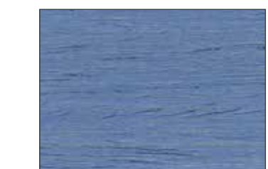
225 Blu Pastello - Pastel Blue - Pastellblau - Пастельно-Синий